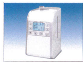
専用ミストファン