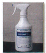
専用スプレーボトル